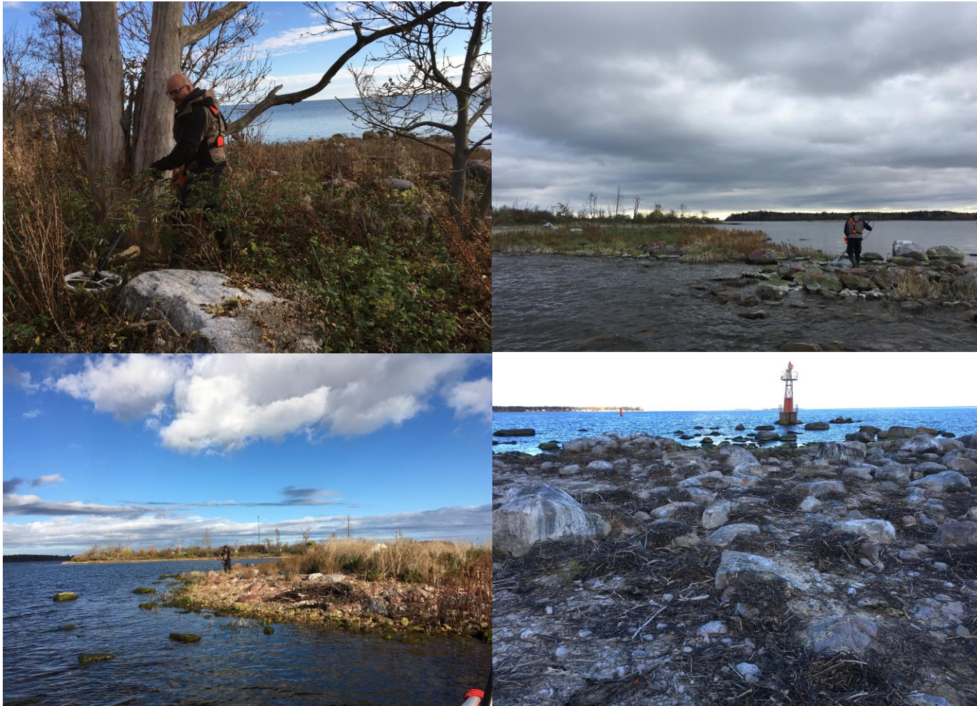
Fig.1-3 Båkharen & Skrädarhällen, Fig.4 Ytterriskan